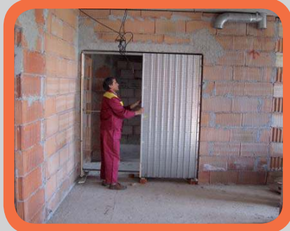
Vložení a usazení stavebního pouzdra do stavebního otvoru dle „vágrysu“