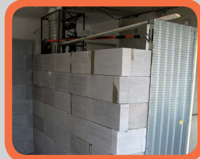
Zazděné pouzdro v příčce (Pozor - nad pouzdrům musí být překlad)