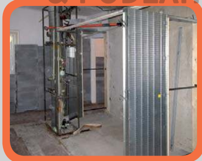
Postavené a vyvážené pouzdro