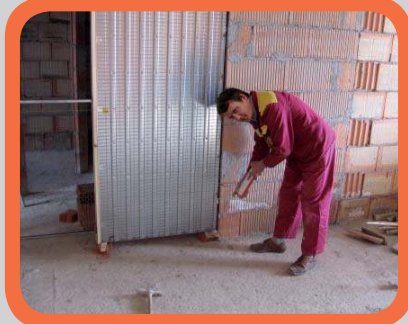
Zapěnění ukotveného pouzdra nízkoexpandivní montážní pěnou