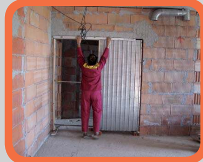
Vyvážení pouzdra horizontálně