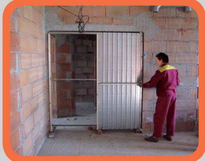
Vyvážení pouzdra vertikálně