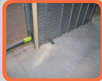
Kotvení pouzdra do podlahy